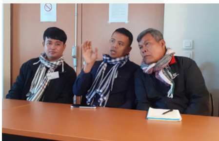
▼ Délégation cambodgienne lors des JRA.

Lien vers la vidéo post journée Réseau : https://www.facebook.com/watch/?v=311453678556544