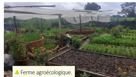
▲ Ferme agroécologique.

Malgré l'histoire cambodgienne du modèle coopérativiste, des coopératives se sont constituées autour de l'accès aux microcrédits puis se sont ensuite diversifiées dans l'achat collectif d'intrants, les banques de semences ou de bovins. Aujourd'hui, certaines coopératives proposent d'autres services comme l'achat et l'utilisation collective de matériel agricole principalement pour le riz. Un certain nombre de coopératives souhaitent développer leur offre de services en proposant une vente collective de produits maraîchers. Les coopératives rencontrées sont dynamiques, elles ont toutes des projets pour le futur, les jeunes s'impliquent dans les organes de décision, le capital et le nombre d'adhésions sont en constante progression.