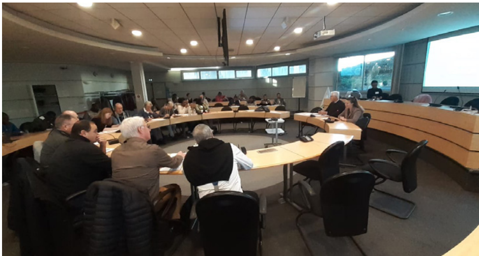
▲ Atelier Jeunes Agriculteurs lors des JRA 2023.

La 2 ème journée, organisée en ateliers, avait pour objectifs, dans le cadre de la révision de la stratégie Afdi 2025, de proposer des réflexions qui alimentent le développement de la stratégie institutionnelle d'Afdi. Les ateliers portaient