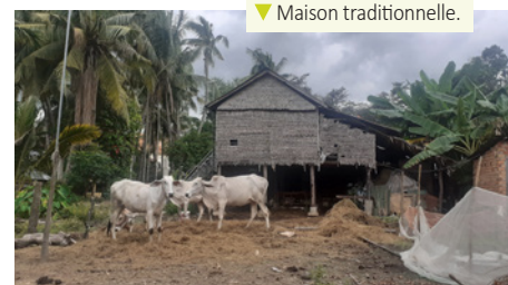
▼ Maison traditionnelle.