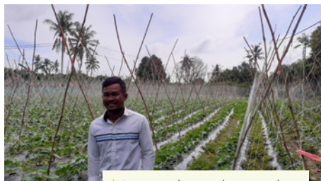
▲ Jeune producteur de concombres.

La Faec, partenaire de l'Afdi, propose plusieurs projets dans l'objectif d'accompagner 11 270 agriculteurs et 52 coopératives du Cambodge en formant au maraîchage, à l'agroécologie et à l'aviculture afin de proposer des alternatives économiques à la production du riz. La fédération accompagne à la construction