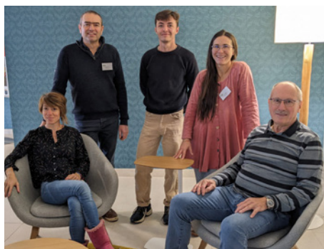
◀ Délégation Afdi Alsace à Caen.

Elles ont aussi été un temps de convivialité et d'échanges entre bénévoles, salariés et partenaires venus du monde entier. Le tout parfaitement accueilli par l'Afdi Normandie, ses bénévoles et ses salariés, qui ont parfaitement relevé le défi de l'organisation d'un tel évènement où environ 200 personnes se sont retrouvées.