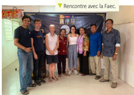
▼ Rencontre avec la Faec.

d'un plan d'affaires et facilite l'accès aux crédits pour les coopératives et agriculteurs individuels.