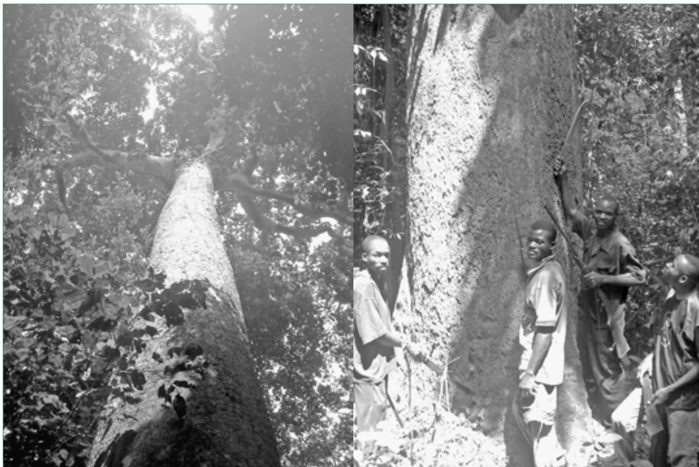
Les hommes sont petits devant les arbres, ici un Bilinga dont le bois est jaune.